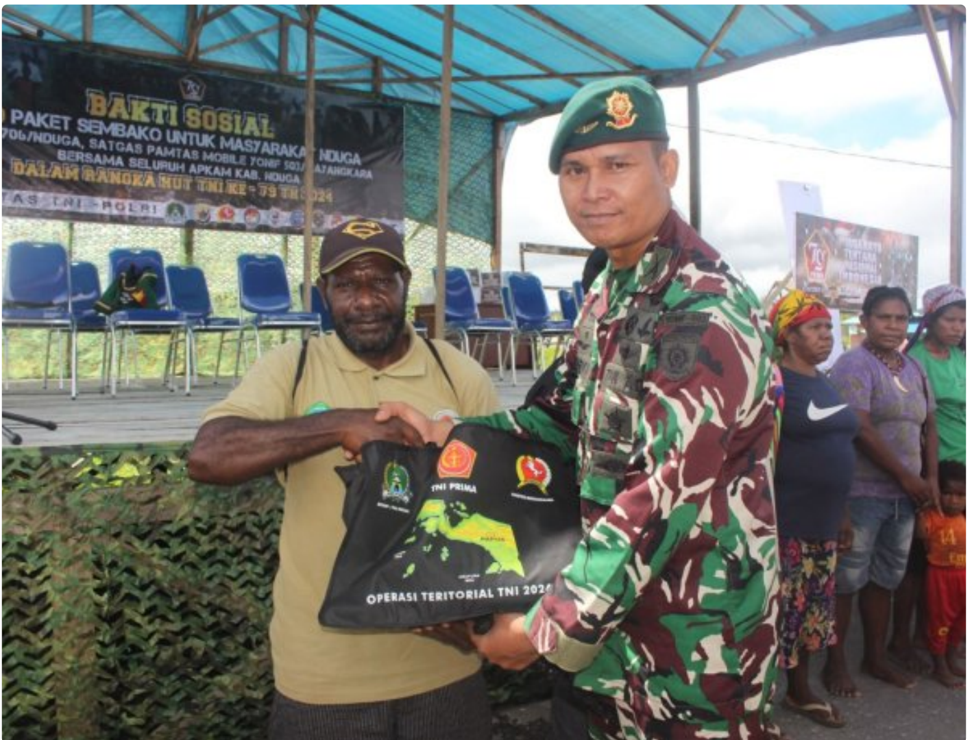
Foto: Satgas Pamtas Mobile RI-PNG Yonif 503/Mayangkara Koops Habema bersama seluruh aparat keamanan (Apkam) Kabupaten Nduga Bagikan 1000 Paket Sembako Dalam rangka HUT TNI Ke - 79, yang Dilaksanakan