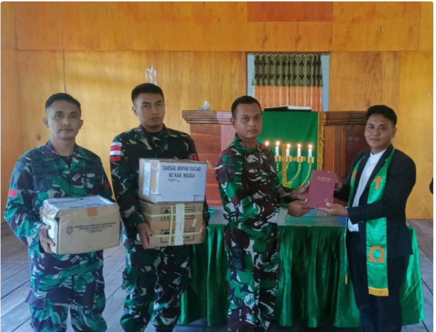
Foto: Satgas Yonif 503/Mayangkara kembali menunjukkan dedikasinya kepada masyarakat di Papua dengan memberikan dukungan alat musik untuk kegiatan ibadah di Gereja GKI Bethesda Batas Batu, Distrik Krepkuri, Kabupaten Nduga. Pada Minggu, 12 Januari 2025.